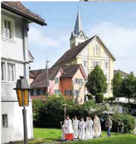
Es war ein frohes Fest