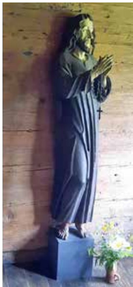
Bruder Klaus-Statue im Geburtszimmer