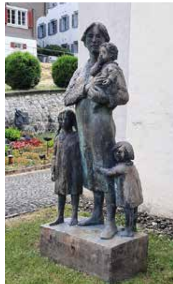
Dorothea-Statue in Sachseln