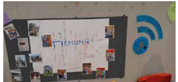
Fotos von Firmanlässen