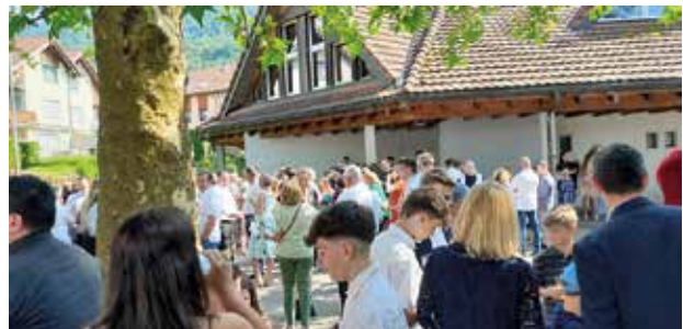
Gemütliches Zusammensein nach der Firmung beim Apéro