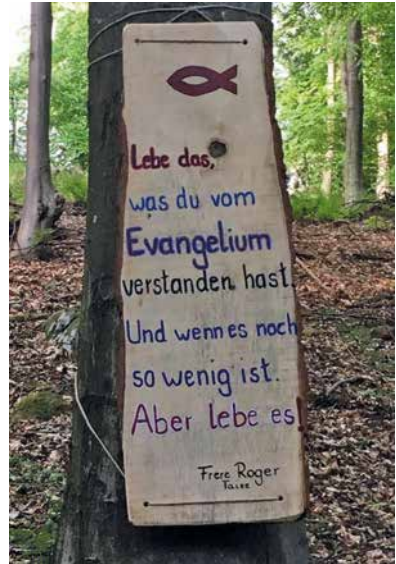
Stele aus dem «Auferstehungsweg» der Pfarrei St. Ansgar, Rendsburg