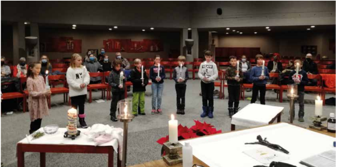
Erstkommunionkinder – 1. Gruppe (16.01.)