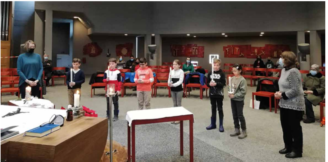
Erstkommunionkinder – 2. Gruppe mit Katechetinnen (17.01.)

Zu guter Letzt: Beachten Sie bitte, dass sich die Öffnungszeiten des Sekretariats geändert haben: Neu montags von 8.00 Uhr bis 12.00 Uhr!