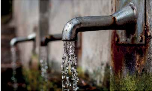
Faucet 1684902

Die IM setzt sich mit materiellen Beiträgen für die Förderung des religiösen Lebens in der Schweiz ein.