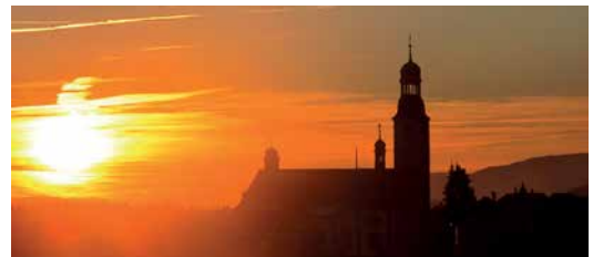
Kirche Oberdorf, Foto© Urban Fink-Wagner

Die IM ist eine nicht gewinnorientierte Organisation (NPO), die ihre Mittel in grösstmöglichem Mass zur Erreichung ihrer Ziele einsetzt. Sie finanziert sich aus Spenden aller Art. Das finanzielle Handeln ist auf den sparsamen Mitteleinsatz und damit auf die Sicherung des Fortbestandes der IM als solidarisches Netzwerk in der römisch-katholischen Kirche in der Schweiz ausgerichtet.