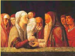
Darstellung des Herrn / Lichtmess