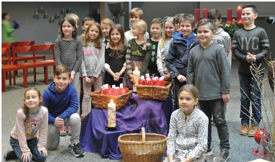
Unsere neuen Erstkommunionkinder 2020 Unsere neuen Firmlinge 2020