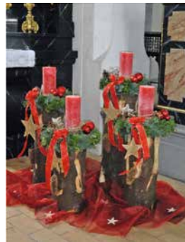
Adventsgesteck in der Pfarrkirche Schübelbach

Damit wurde die Zeit für die Kinder erfahrbar. Trotz ihres schweren Starts ins Leben und der für viele ungewissen Zukunft, wurde es den Kindern mit jeder Kerze, die den Adventskranz immer heller erstrahlen liess, immer heller, leichter und wärmer ums Herz.