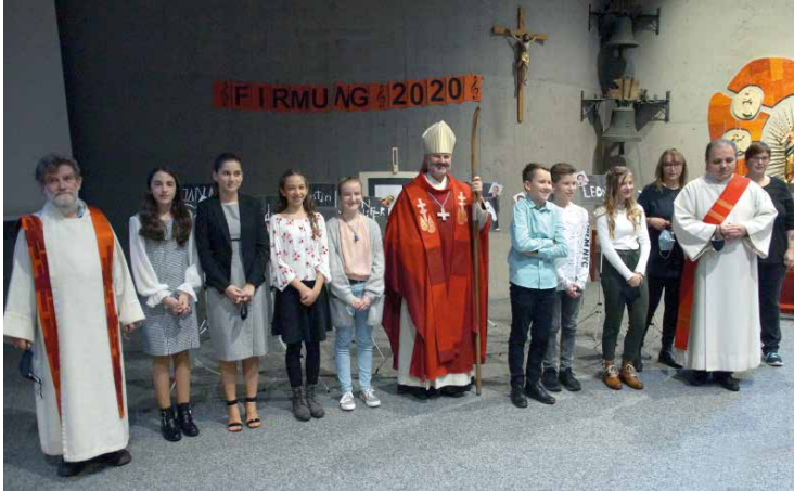
Impressionen von der Firmung 2020