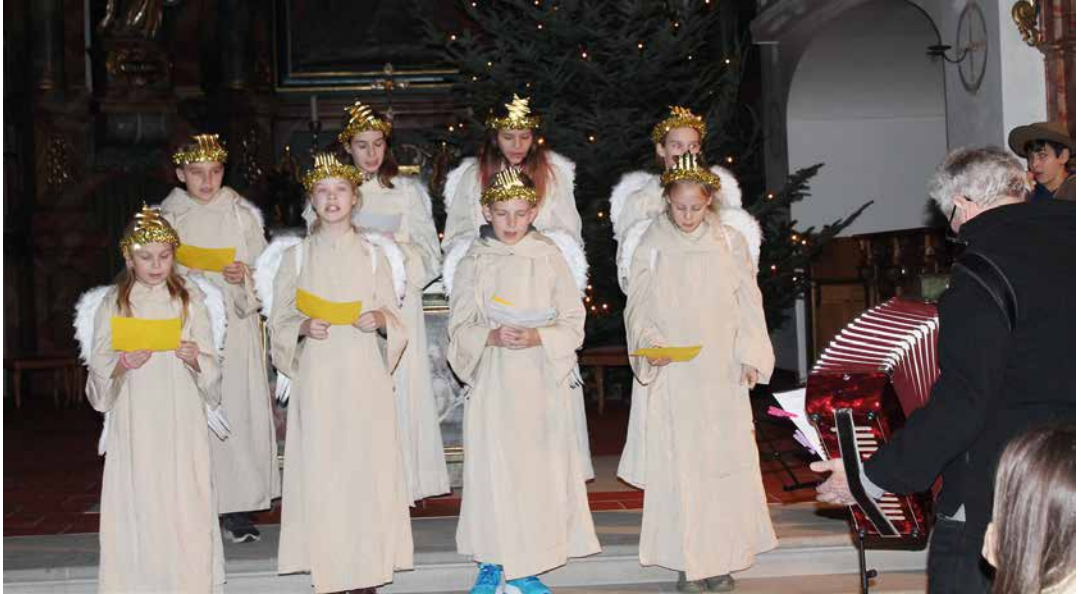
Krippenspiel Weihnachten 2018