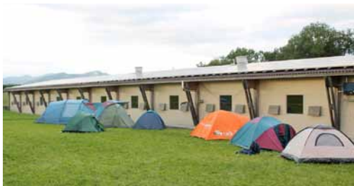
Ein Teil des Zeltlagers