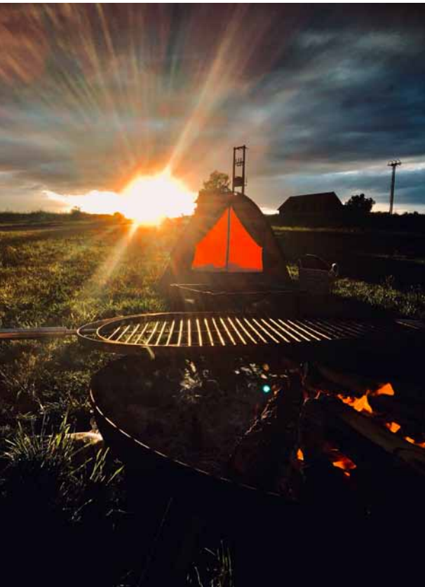
Abendstimmung im Zeltlager