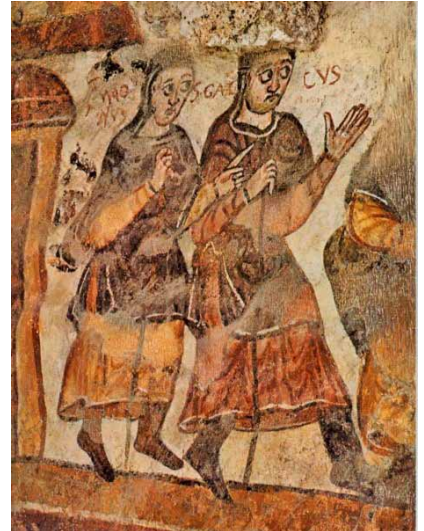
Hl. Magnus (links) mit Gallus. Fresko in der Magnuskrypta der Stadtpfarrkirche St. Mang in Füssen

Magnus gründete im heutigen Füssen eine klösterliche Gemeinschaft. Hier, in Füssen, ist der Heilige Magnus begraben. Über seiner Grabstätte wurde das Benediktinerkloster St. Mang erbaut.