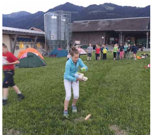
Bei den Spielen brauchte es Geschicklichkeit, aber auch Schnelligkeit