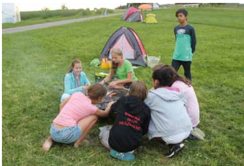
Das Feuer fest in Mädchenhand