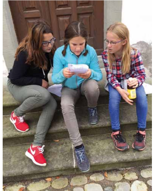
Ministranten studieren die gefundenen Anweisungen