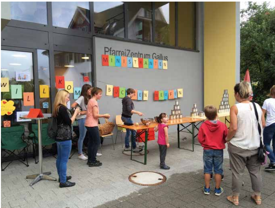
Die Ministranten laden zum Büchsen-schiessen ein

Vielen herzlichen Dank an alle Spenderinnen und natürlich auch den vielen Besuchern.