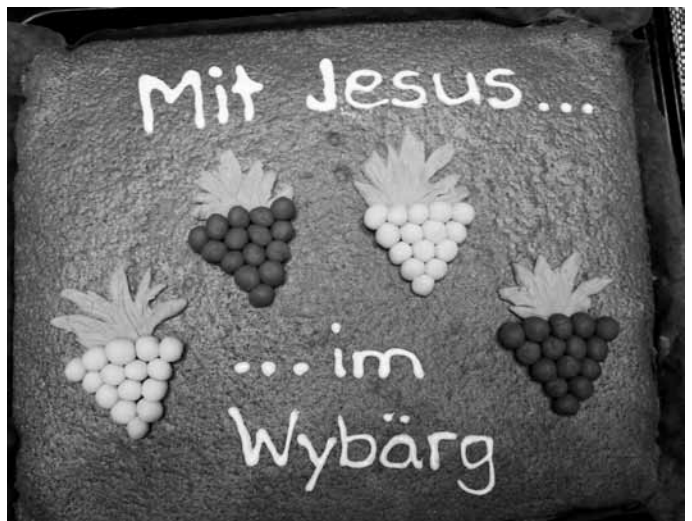
Zum Vorbereitungstag wird sogar der Kuchen von den Eltern dem Thema angepasst!