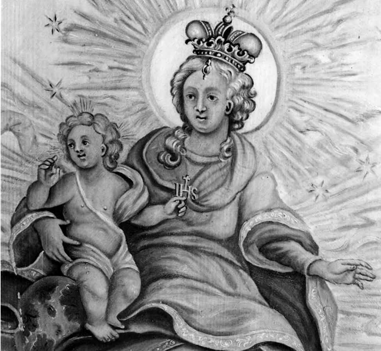
Deckengemälde (1760) ehem. Kartause, Ittingen